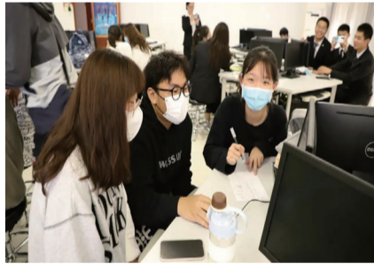
分析规划中的参赛人员

“千淘万漉虽辛苦，吹尽狂沙始到金”，为培养学生营销兴趣，提升学生营销能力，促进学生间团队协作，充分理解友谊第一比赛第二的内涵，我院 E&M 学社第二届“模拟营销之道”大赛于 2021 年 9 月 22 日在办公楼二层财管实验室成功举办。