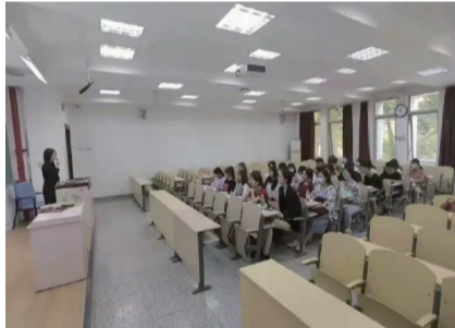
2021 级新生学习入党知识

在开展新生入党启蒙教育的同时学院也开展了 2021 级新生主题班会，班会期间，学生党员就新生入学后要进行的各项事宜作出