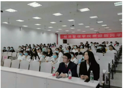
经济管理学院召开新生团学宣讲会