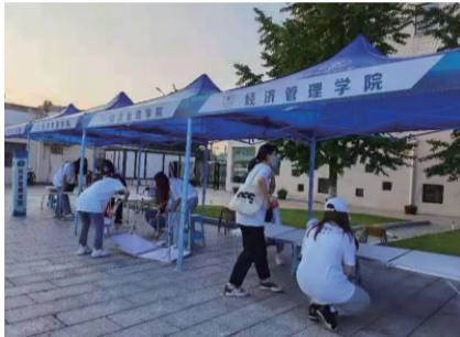
迎新志愿者进行迎新准备工作

取校园卡、缴纳学费、购买考试耳机等一系列流程，在此期间迎新志愿者全程给予了引导。 在新生报到期间，校、院级领导与各职能部门负责人来到我院报到处视察迎新工作进展情况，指导迎新工作。领导着重强调了疫情期间的安全问题，要求做好疫情防控工作并同前来的新生们亲切交谈。新生完成迎新流程之后乘校车到西校报到。西校依旧有