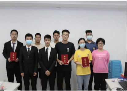
三等奖获得者合影

本次活动成功激发同学们在统筹营销方面的兴趣，深挖其缜密分析的能力。并使参赛人员梳理事物彼此间内在逻辑，了解以营销方法全面分析事物因果关系的益处。最终使同学们学习到更理性更客观的方法和高效