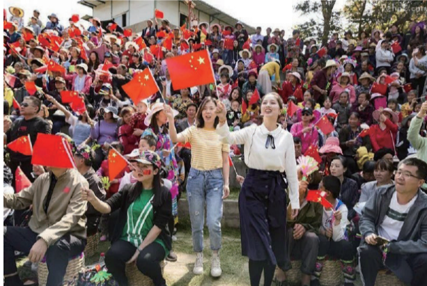
《我和我的祖国》快闪活动

一首歌有个人的情感记忆，也有民众的精神寄托和时代的情感象征，无数个人被音乐触发的情感深处的悸动便是民众心灵深处的集体精神依归。