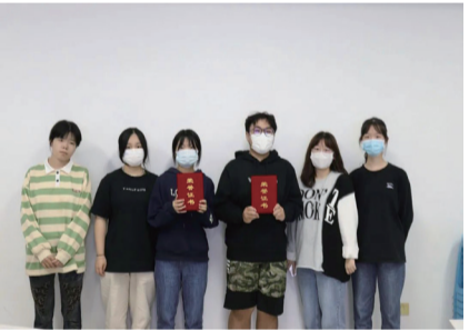
二等奖获得者合影

各季度中，小组经营投资活动所产生的现金流量会影响市场份额的变化。小组成员需运用自身所学营销知识，通过观察汇率以