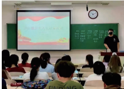
2021 级新生入党启蒙教育

了明确的说明，对新生进行了专业课程的介绍、宿舍管理制度介绍等。通过此次教育活动，2021 级新生对中国共产党有了进一步了解，让新生感受到了学院的温暖和关怀。通过入党启蒙教育和班会，希望能帮助同学们更快地融入新的班级，调整状态以迎接新学期的