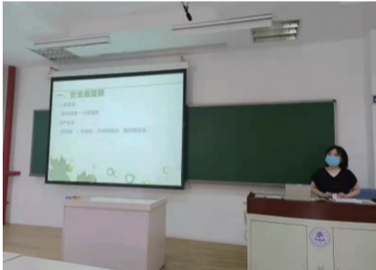
21 级新生辅导员进行安全教育

2021 年 9 月 2 日，我院学生党员们深入 2021 级新生群体，开展入党启蒙教育活动。此次活动由各班导员组织召开。活动的主要内容是通过讲解有关党的知识，让新生了解党的性质、宗旨以及指导思想。同时让学生学习入党的基本条件，了解入党积