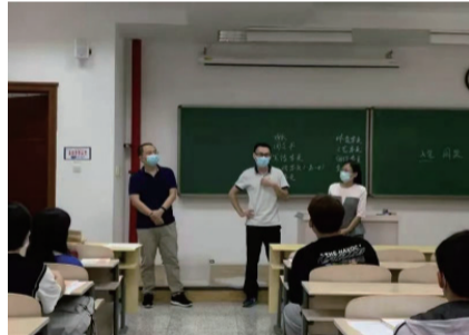
院领导与同学们展开交流

2021 年 9 月 2 日，我院学生党员们深入 2021 级新生群体，开展入党启蒙教育活动。此次活动由各班导员组织召开。活动的主要内容是通过讲解有关党的知识，让新生了解党的性质、宗旨以及指导思想。同时让学生学习入党的基本条件，了解入党积