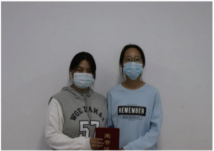
一等奖获得者合影

赛章程，各司其职并及时完成每季度的任务。季度末将根据参赛组盈利表现、市场表现、成长表现以及紧急借款等数据计算其综合得分。