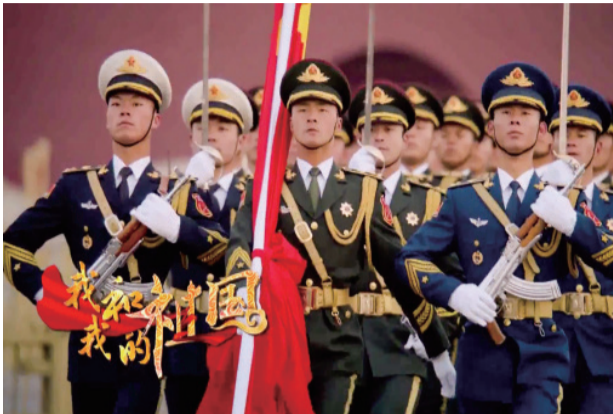
《我和我的祖国》乐曲MV截图

此作品经年不衰、历久弥新，如一枚珍珠铭刻在共和国苦难辉煌、励精图治的历史中，闪烁着永恒的光芒，带给我们始终如一温暖。一首歌有个人的情感记忆，也有民众的精神寄托和时代的情感象征，无数个人被音乐触发的情感深处的悸动便是民众心灵深处的集体精神依归。