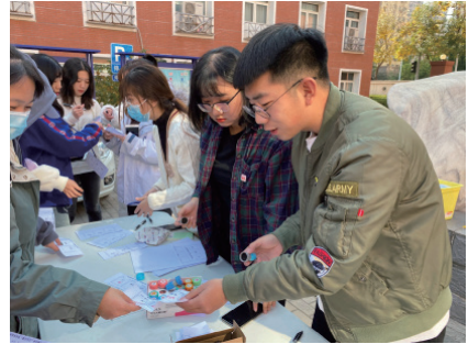
签到处工作人员引导大家登记信息