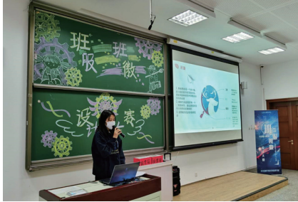
参赛班级讲解员阐述设计理念