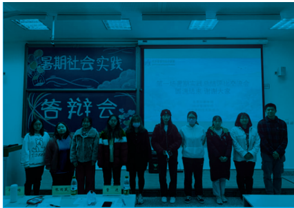
三等奖获奖团队与评委合影

本次答辩会的获奖团队如下： 一等奖：战“疫”青春、青春邮递员 二等奖：绽放战疫青春·鉴定制度自信、