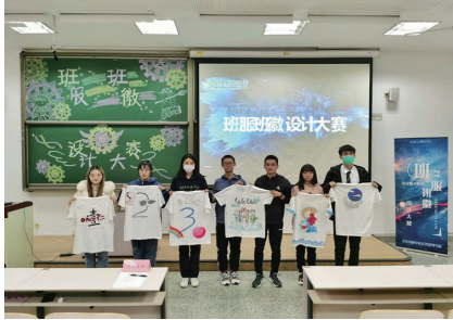
各班展示手绘班服

为加强校园文化建设，进一步增强班级凝聚力，彰显大学生的青春活力，11 月 8 日晚七点，经济管理学院分团委宣传部于教学