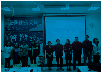
二等奖获奖团队与评委合影

本次答辩会的各个实践团队从社会生活的方方面面入手进行了精彩答辩，涉及主题包括抗击疫情、公共卫生、垃圾分类等多个方面，展示了经管学子的优秀素质和良好精神风貌。