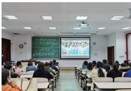
参会人员观看合唱献词视频