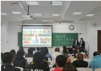
同学们观看献词视频

为深入推进习近平新时代中国特色社会主义思想在学生群体中落地生根，扎实巩固党史学习教育活动和“永远跟党走”主题教育活动成果，广泛宣传学校服务保障“七一”系列重要活动各工作专班涌现出的师生动人事迹，我院自 2021 年 10 月 21 日起组织开展了学习贯彻习近平总书记“七一”重要讲话精神宣讲活动。第一场“百年党史主题教育——‘七一’庆祝活动宣讲团分享交流会”于 21 日下午在教学楼 405、407 开展。经济