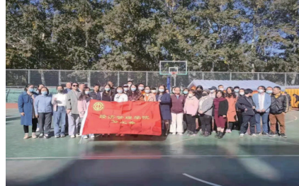
教职工参与健步走活动