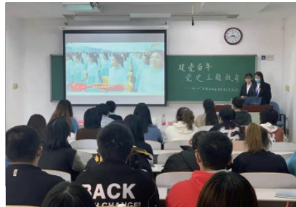
同学们观看合唱视频

为深入推进习近平新时代中国特色社会主义思想在学生群体中落地生根，扎实巩固党史学习教育活动和“永远跟党走”主题教育活动成果，广泛宣传学校服务保障“七一”系列重要活动各工作专班涌现出的师生动人事迹，我院自 2021 年 10 月 21 日起组织开展了学习贯彻习近平总书记“七一”重要讲话精神宣讲活动。第一场“百年党史主题教育——‘七一’庆祝活动宣讲团分享交流会”于 21 日下午在教学楼 405、407 开展。经济