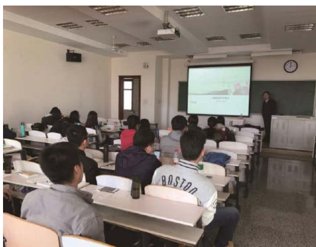
老师们检查宿舍安全状况

为加强我院会计专业硕士对于竞争性行业中的绩效管理和绩效评价的了解，增加学生运用管理和会计知识的视野、拓宽学生的眼界，2017年3月13日下午，经管学院邀请和君咨询高级业务合伙人孙朋军博士在西校区403教室举办了“战略绩效管理及实务案例”的实务讲座。孙朋军先