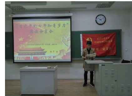
党支部成员分享阅读心得

4月19日上午，经济管理学院研究生第一党支部开展了“习近平的七年知青岁月”读书分享会。党支部成员认真阅读了习近平