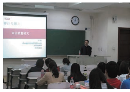
现场同学们认真听讲

为了落实学校研究生学术月的安排，2017年4月19日上午，我院邀请到中国人民大学商学院张敏副教授为财务会计系教师和2016级会计专业硕士开展了主题为“审计质量研究”的专题讲座。张敏老师主要从事审计领域的教学和研究工作，主持、参与多项国家自然科学基金的研究工作，在《管理世界》、《会计研究》、《审计研究》等财经领域顶级期刊发表数十篇学术论文。